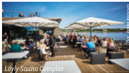
Löyly Sauna Complex