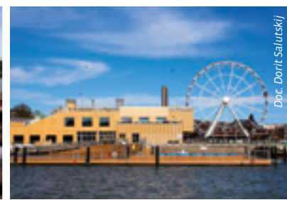
Allas Sea Pool